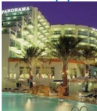
מלון דן פנורמה